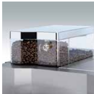
+ Verse koffiebonen