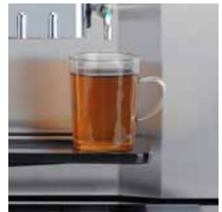
+ Aparte uitloop voor heet water