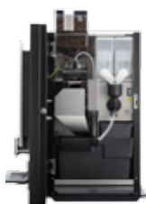
OB 3 (XL) NG