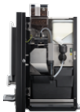
OB 2 (XL) NG