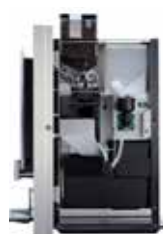
OPTIBEAN 2 (XL)