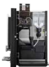
OPTIBEAN 3 (XL) TOUCH