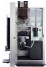
OPTIBEAN 3 (XL)