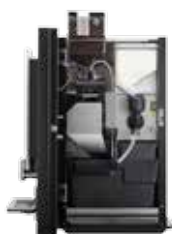
OPTIBEAN 2 (XL) TOUCH